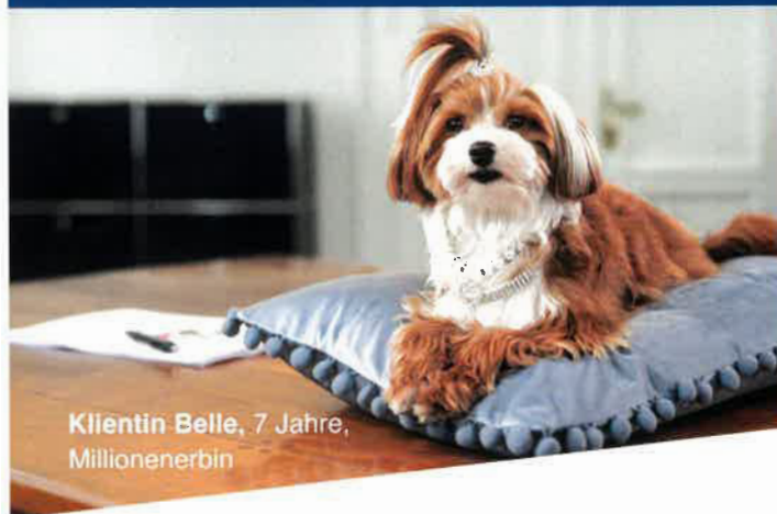
Klientin Belle, 7 Jahre, Millionenerbin

Mit all deinen vielseitigen Aufgaben bist du eine wichtige Unterstützung für Notar:innen!